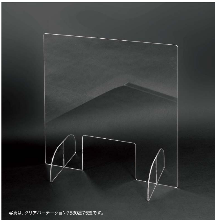
写真は、クリアパーテーション7530高75透です。